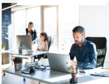
OFICINAS Y EDIFICIOS