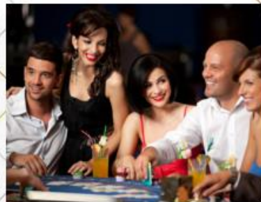
CASINOS Y HOTELES